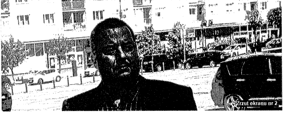
Zrzut ekranu nr 2

Nadszedł czas powstrzymania hejtu i zwykłego chamstwa! Oczywiście na gruncie powództwa cywilnego.