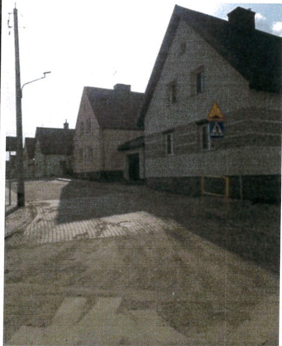
ul. Zielona po przebudowie