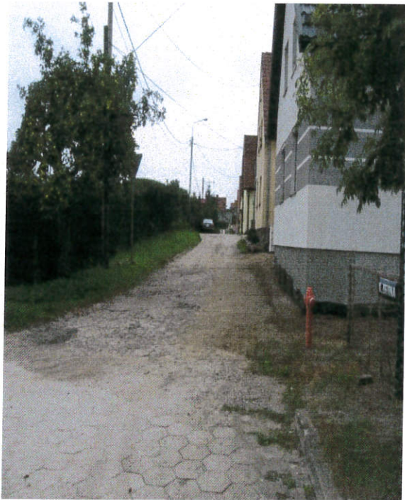
ul. Zielona przed przebudową