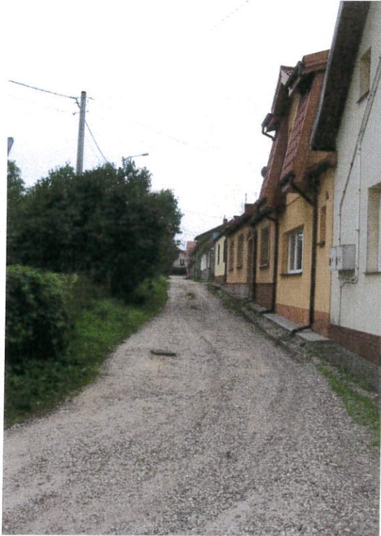
ul. Cicha przed przebudową