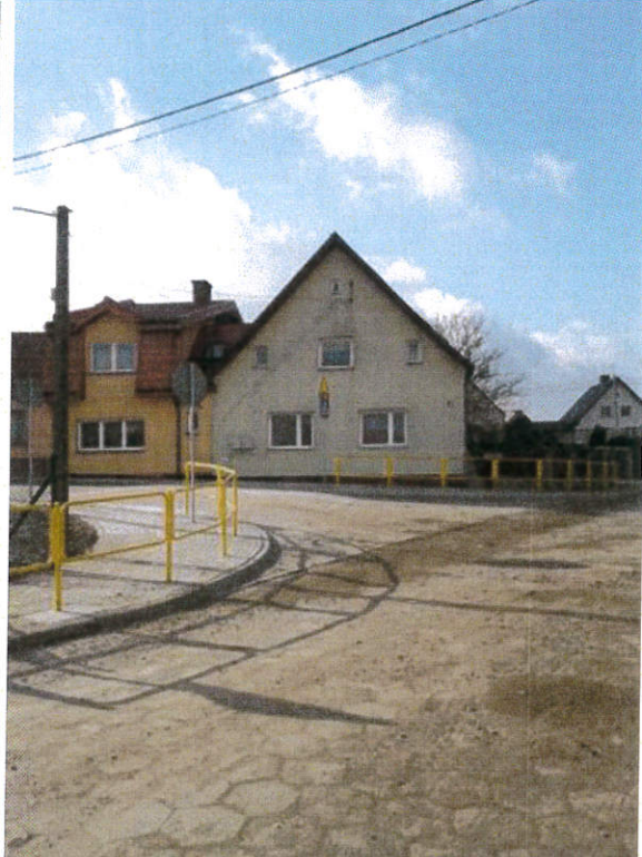
ul. Cicha po przebudowie