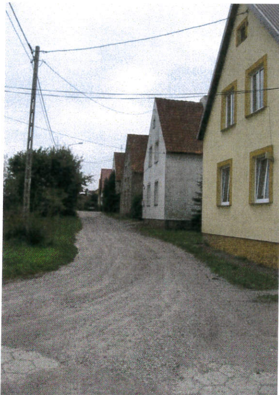
ul. Mała przed przebudową