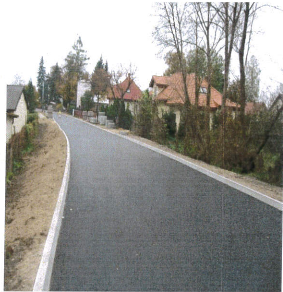
Po zakończeniu budowy