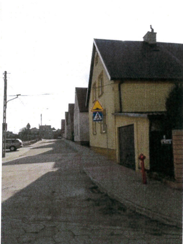
ul. Mała po przebudowie